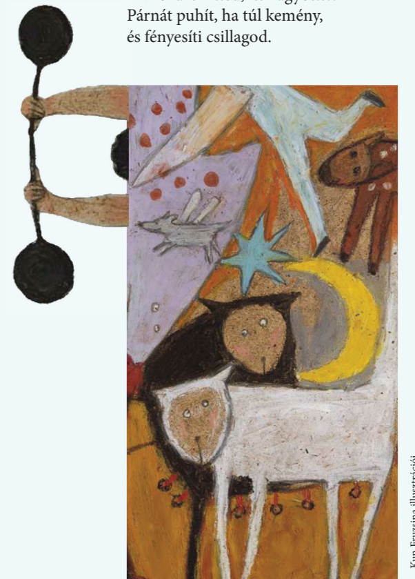
Kun Fruzsina illusztrációi

Valaki ül az ág hegyén. Akiről azt hitted, itt hagyott... Párnát puhít, ha túl kemény, és fényesíti csillagod.