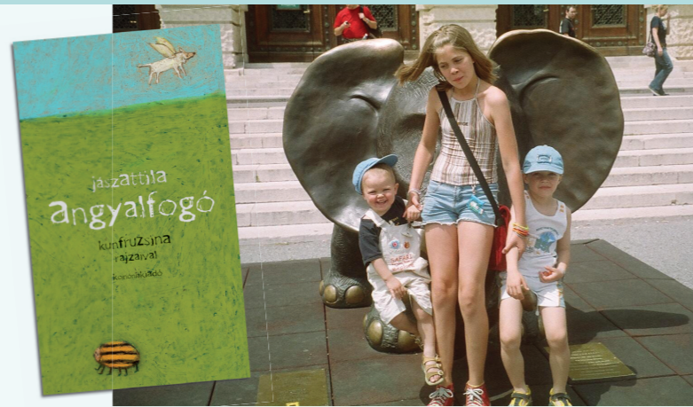
Folyton buzgó ihletforrásaim